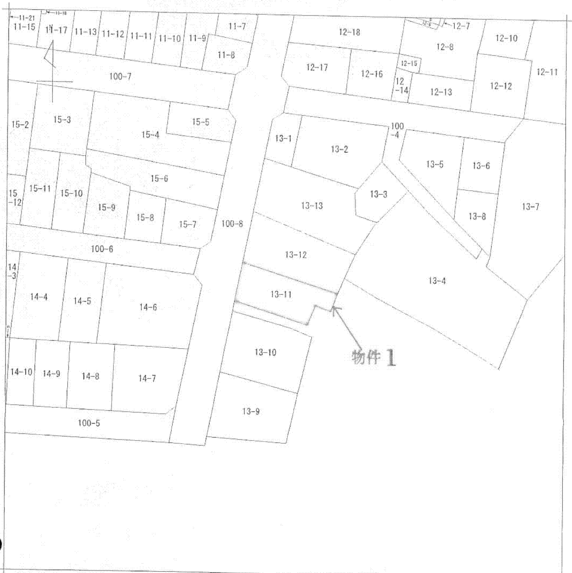
本図面はA3判をA4判に縮小したものである。

(注) 地図に準ずる図面は、土地の区画を明確にした不動産登記法所定の地図が備え付けられるまでの間、これに代わるものとして備え付けられている図面で、土地の位置及び形状の概略を記載した図面です。